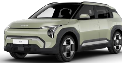
Aventurine Green (AG3) metalizowany