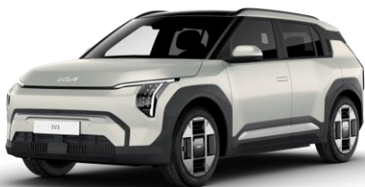
Ivory Silver (ISM) matowy