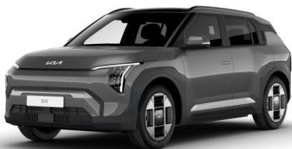
Shale Grey (EBD) metalizowany