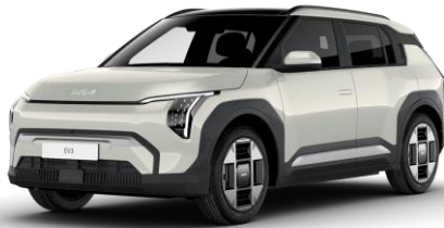
Ivory Silver (ISG) metalizowany