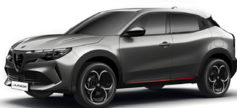
519 SZARY - ARESE