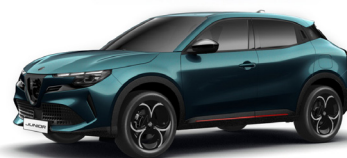
688 NIEBIESKI - NAVIGLI