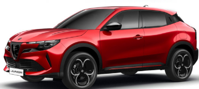
136 CZERWONY - BRERA