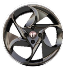
17" Felgi aluminiowe Diamond Cut Kod opcji 1M3