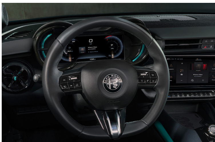
Panel zegarów „Cannocchiale”