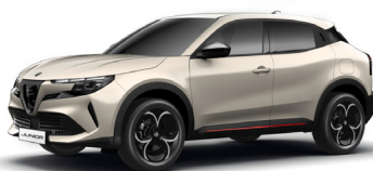
636 SZARY - SCALA