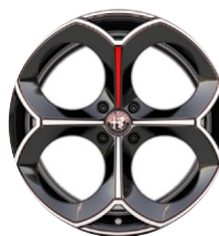
20" Felgi aluminiowe Perfo Kod opcji 5RK