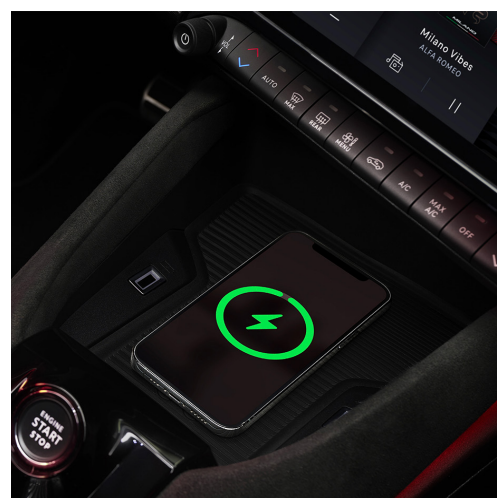
Bezprzewodowa ładowarka smartfona