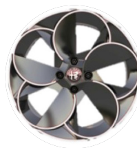
18" Felgi aluminiowe Diamond Cut Kod opcji 1M5