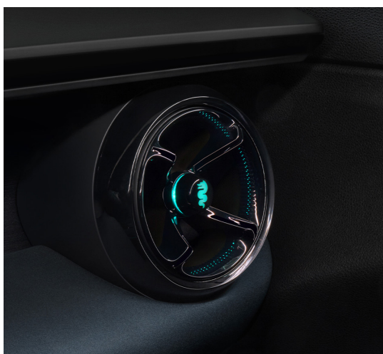
Podświetlenie bocznych nawiewów powietrza