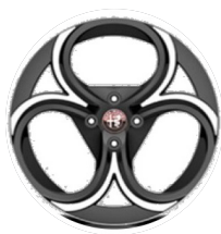
18" Felgi aluminiowe Progressive Kod opcji WP8