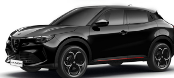
601 CZARNY - TORTORA