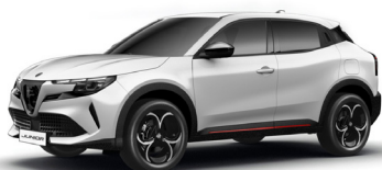
268 BIAŁY - SEMPIONE